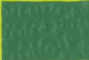
GT2500 グリーン / シルバー