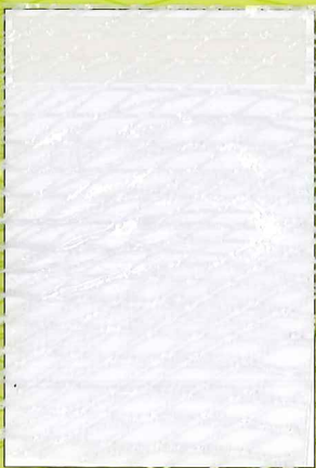
EE200 (137cm×#200) 透明・50m 乱