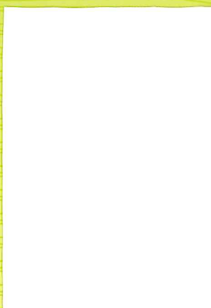
EE200 (137cm×#200) 白・100m 乱